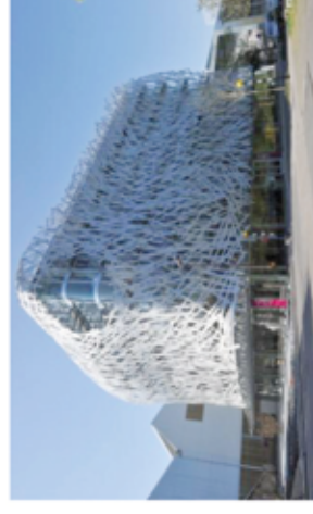
Bâtiment Manny / Ile de Nantes

APLIBODE Bloc Larrey – CCVT, CHU Angers, 4 rue Larrey 49 933 ANGERS Cedex 9 aplibode@gmail.com